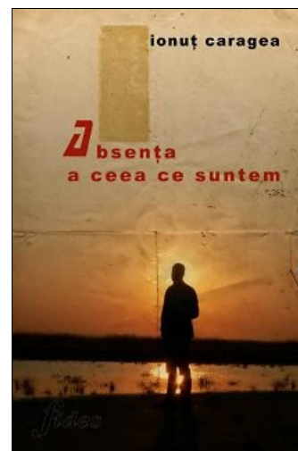
Ceva din mine caută ceva

Ceva din mine caută singurătatea, ceva caută oamenii. Bine că am ce alege. Ceva din mine caută lumina, ceva caută întunericul. Bine că pot arde, bine că mă pot stinge. Ceva din mine caută liniștea, ceva caută larva. Bine că există cuvântul. Ceva din mine caută moartea, ceva caută nemurirea. Bine că există cerul. Ceva din mine caută ceva din tine. Bine că există iubirea. Ceva din mine caută adevărul, ceva caută minciuna. Bine că există cugetul. Ceva din mine caută totul, ceva caută nimicul. Bine că există ceva care caută ceva. Ceva din mine caută suferința, ceva caută alinarea. Bine că există lacrima. Ceva din mine caută fericirea. Bine că există speranța. Ceva din mine caută agonია, ceva caută extazul. Bine că mai pot să respir. Ceva din mine îl caută pe Dumnezeu, ceva îl caută pe diavol. Bine că am în cine să cred și de cine să mă lovesc. Ceva din mine caută uitarea, ceva caută amintirea. Bine că mai există visele. Ceva din mine caută o secundă, ceva caută un minut, Ceva caută o oră, ceva caută o zi, ceva caută o lună, Ceva caută un an, ceva caută o viață, Ceva caută mereu ceva.