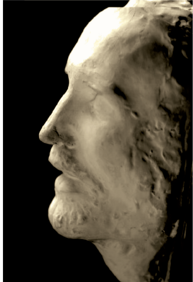
Eminescu și masca lui mortuară