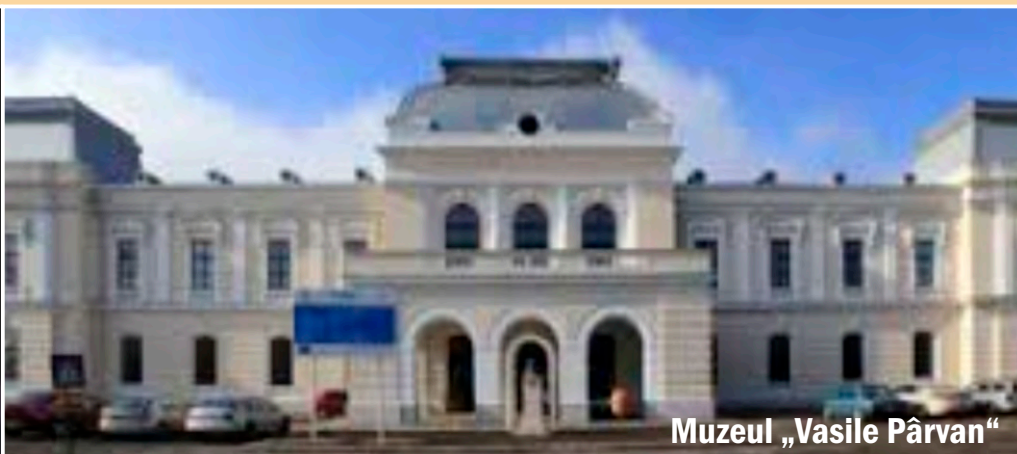
Muzeul „Vasile Pârvan“