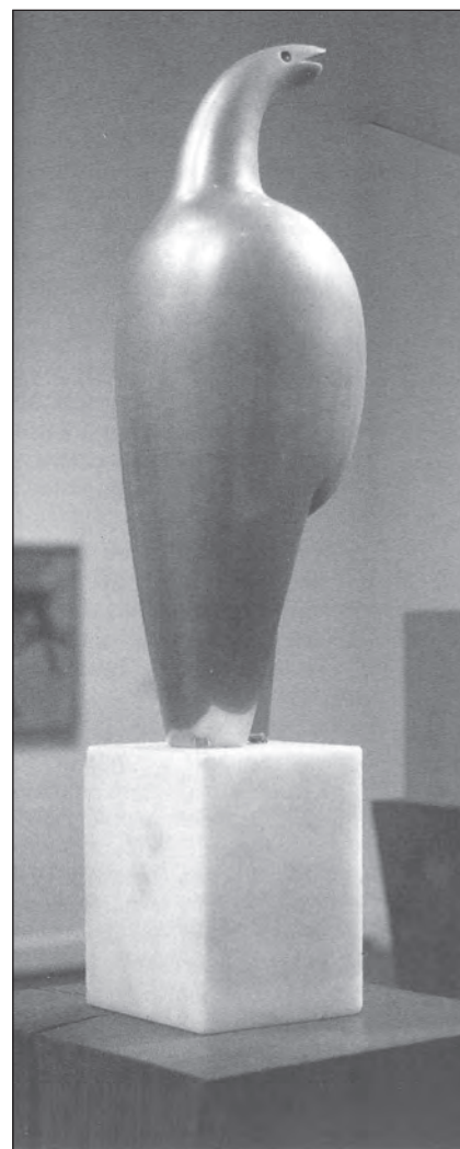
Pasărea Măiastră - C.Brâncuși

chiar acum cineva îmi întinde cuvântul de trei litere care-mi strepezește dinții