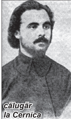
călugăr la Cernica

REVISTĂ TRIMESTRIALĂ DE LITERATURĂ ȘI ARTĂ