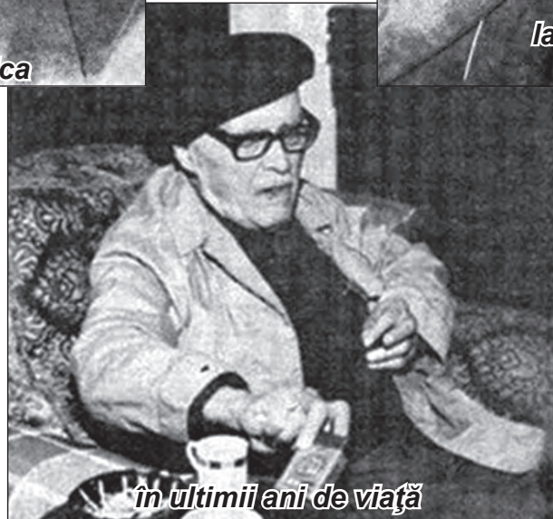
în ultimii ani de viață