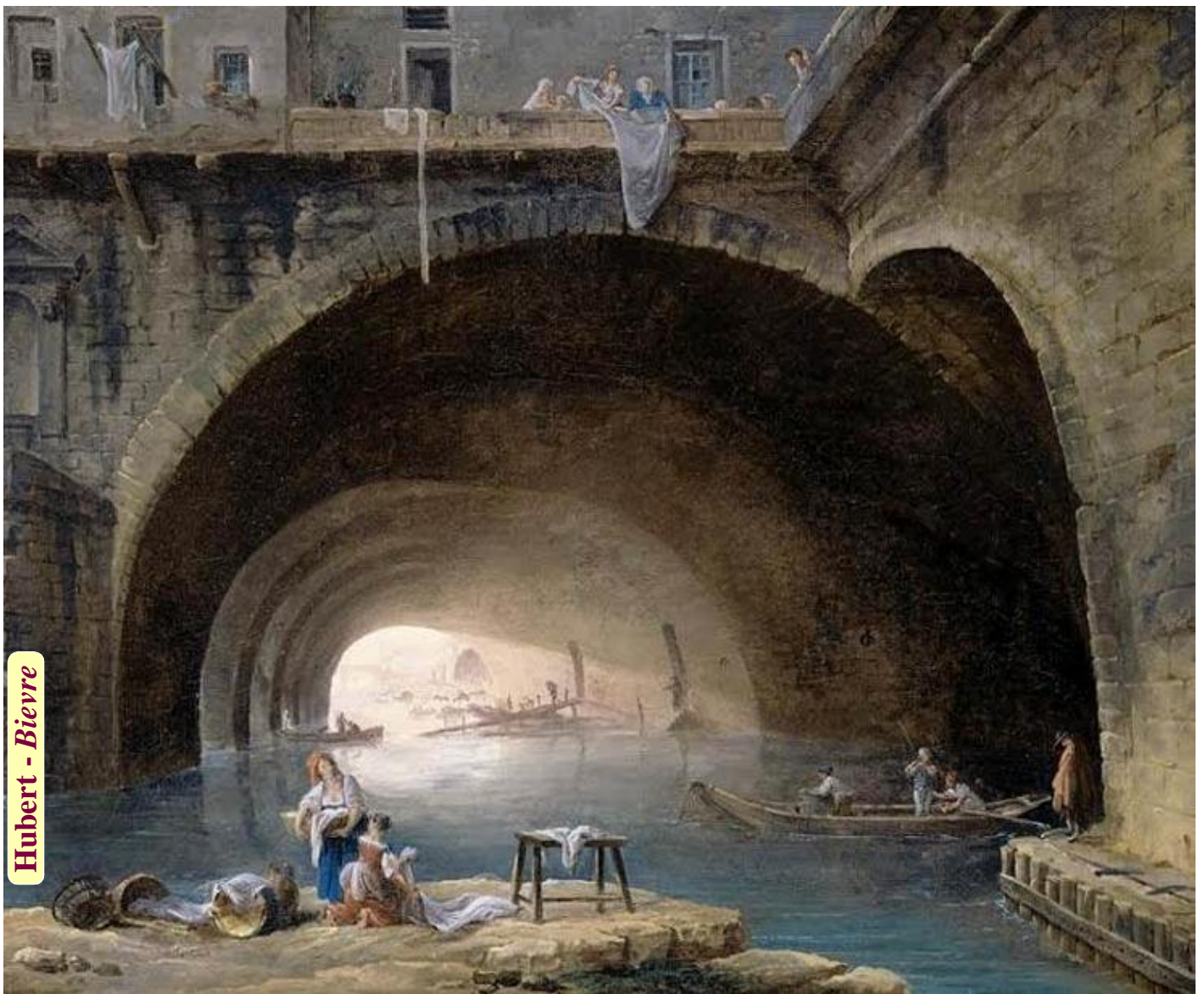
Hubert - Bievre