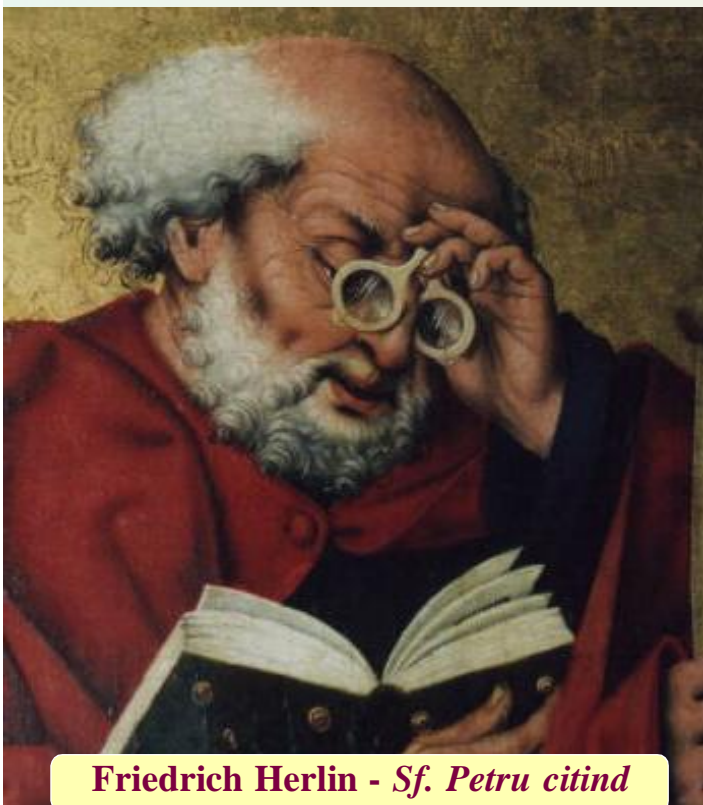
Friedrich Herlin - Sf. Petru citind

Nu-i cereți poetului să scrie la comandă, să aibă revelații spontane sau să vă explice ce a simțit el cândva. Experiențele sunt irepetabile, explicațiile sunt irelevante și anoste. Este de ajuns să-l citiți pe poet și să rămâneți în suflet cu sentimentul acela al îndrăgostitului veșnic, al nemuritorului prin cuvânt.