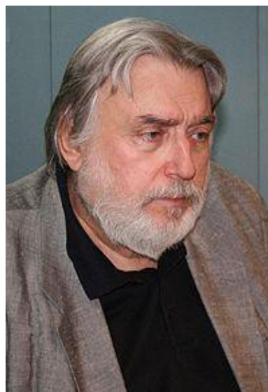
ADRIAN PĂUNESCU (1943-2010)