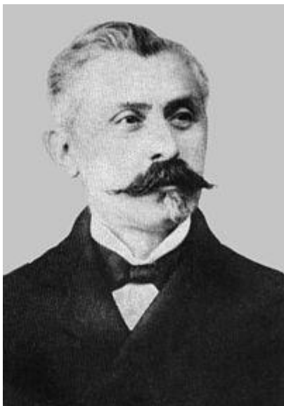
SPIRU HARET (1851-1912)