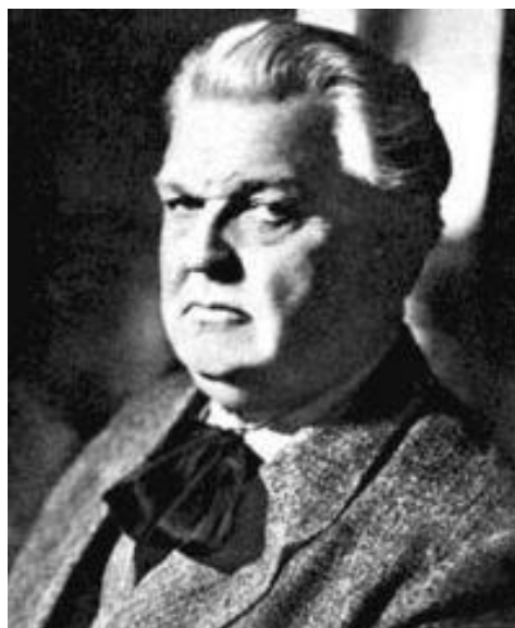
MIHAIL SADOVEANU (1880-1961)