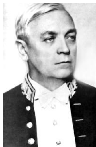
LIVIU REBREANU (1885-1944)