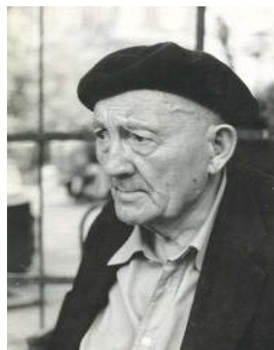
PETRE ȚUȚEA (1902-1991)