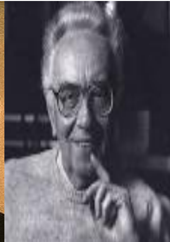
VINTILĂ HORIA (1915-1992)