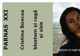
CRISTINA BONCEA - BLESTEM ȘI RUGĂ ȘI ABIS