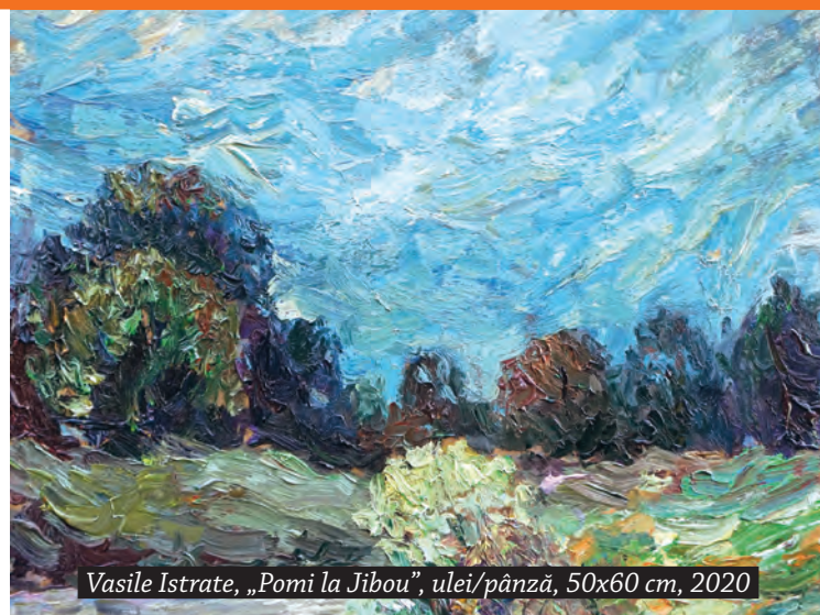
Vasile Istrate, „Pomi la Jibou”, ulei/pânză, 50x60 cm, 2020