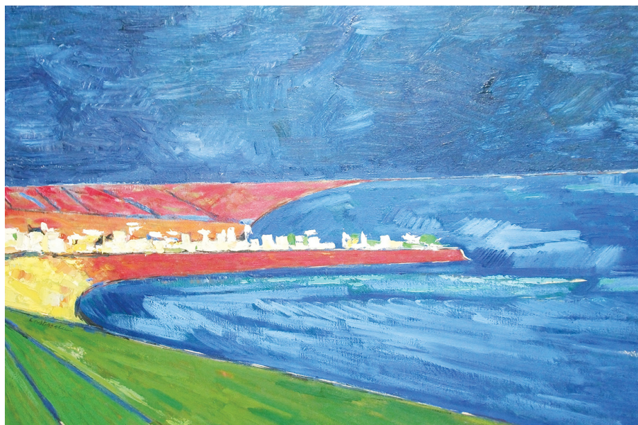
Radu Costinescu - Constanța văzută de la Agigea, 1964